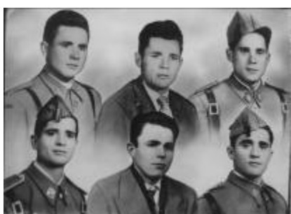
Yo estoy en la fila de abajo, el de la derecha. Los otros son mis hermanos

Fueron pasando los meses y el día uno de noviembre de 1957 me fui con tres meses de permiso. Al mes justo se presentó la guardia civil en mi casa y me entregó un telegrama con la orden de que me presentara inmediatamente en el cuartel. Yo no les hice mucho caso y me presenté a los cinco días en Vélez de Benaudalla, donde estaba el cuartel de la Guardia Civil. Estuve todo el día esperando que pasara un coche que me llevara al cuartel de infantería, Regimiento Infantería Córdoba 10. Me presenté al capitán, ya era de noche. Esa misma noche me entregaron una mochila que no podía con ella. Nos dieron manta, careta antigás, 120 balas, 6 bombas de mano, paquete de cura individual, el mosquetón Mauser español. Nos subieron al tren sobre la una de la madrugada y nos llevaron para Sidi Ifni, pero cuando llegamos a Cádiz nos bajaron del tren y nos llevaron al cuartel de infantería, nos acomodaron a todo el regimiento, hasta nueva orden. Todo esto sucedió el día cinco de diciembre de 1957, hasta el día ocho de junio. Durante estos seis meses que